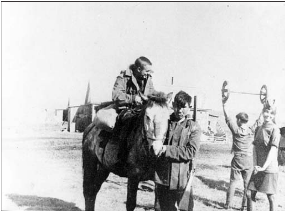
Лето 1967 г. Гиль отправляется на Горячие ключи в хребты, п. Палана