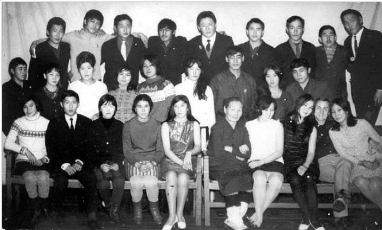
Корякский национальный ансамбль танца «Мэнго» на встрече с комсомольцами в Якутии, Усть-Алданский район, пос. Кэптэни, 6.11.1968 г.