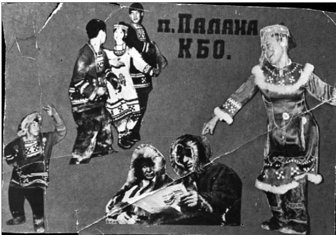
Первая афиша «Мэнго», 1970 г. п. Палана, фотоателье КБО