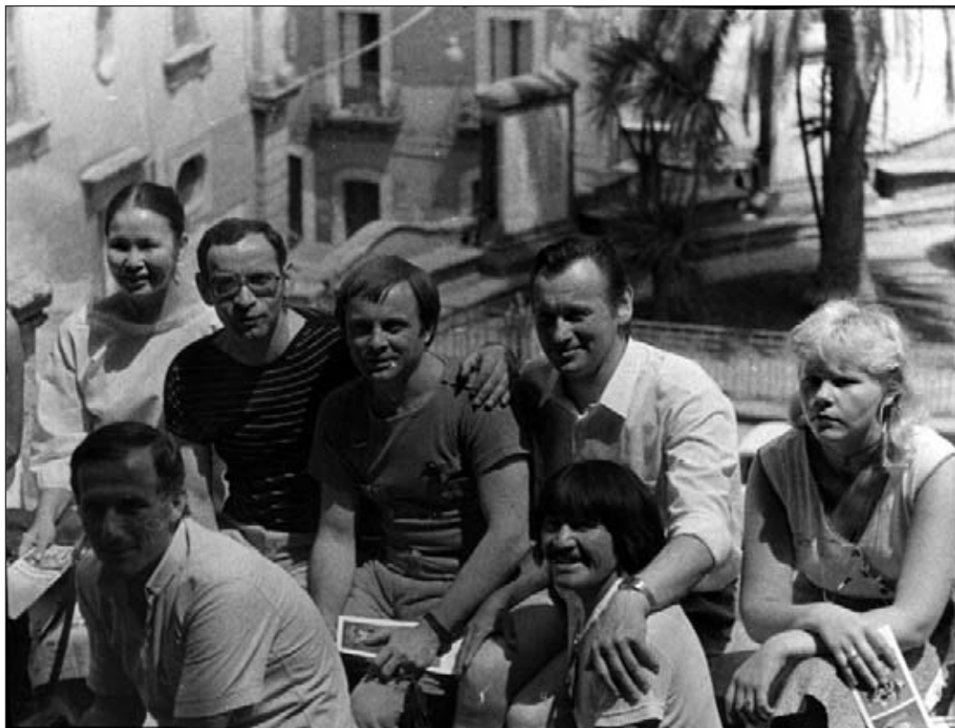
Италия, г. Кальтеджироне, гастроль «Мэнго» 1984 г.