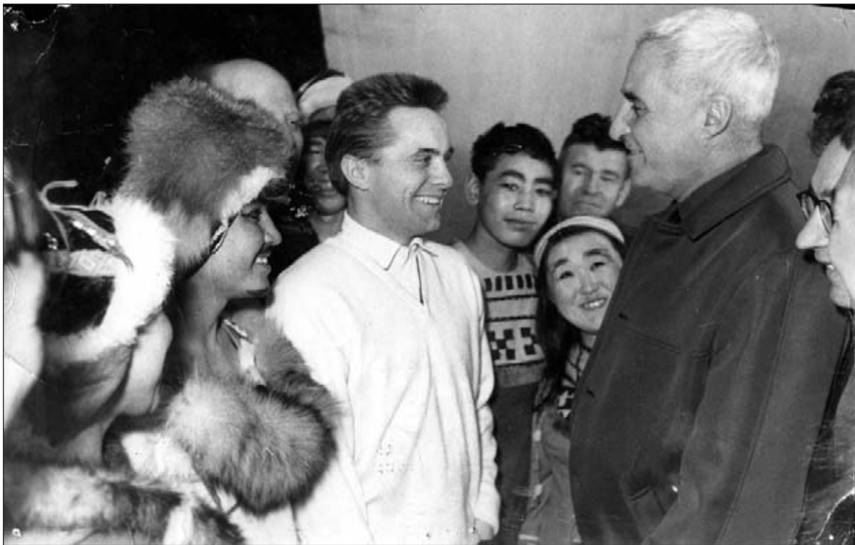
Гиль с артистами беседует с Константином Симоновым после концерта, г. Хабаровск