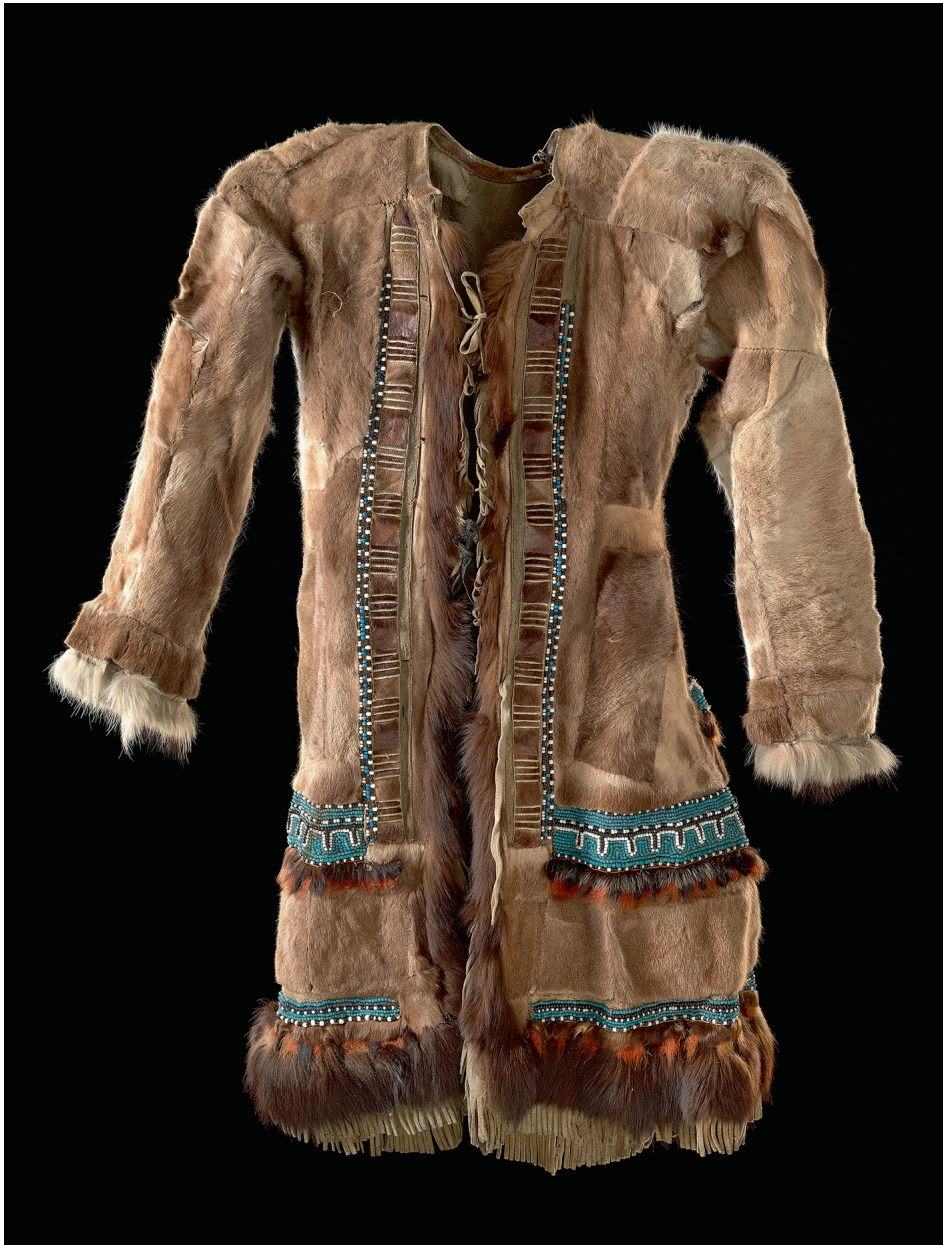
Abb. 4 Evenische Festkleidung · I A 2247, Staatliche Museen zu Berlin – Preußischer Kulturbesitz © Ethnologisches Museum, Foto: Claudia Obrocki.

Arzt und Forschungsreisenden. 7 Nach seinem Studium der Medizin an der Universität Dorpat (heute Tartu in Estland) reiste Bunge 1881 auf Fürsprache des einflussreichen Zoologen Leopold von Schrenck als Arzt und Assistent mit einer Expedition der Russischen Geographischen Gesellschaft ins Lena-Delta. Bunge nutzte diese Reise, um umfangreiche paläontologische, zoologische und botanische Sammlungen anzulegen. Von 1885 bis 1886 führte er unter der Leitung der Kaiserlich-Russischen Akademie der Wissenschaften in St. Petersburg gemeinsam mit dem Zoologen und Mineralogen Baron Eduard Toll die überwiegend naturkundliche „Expedition nach den Neusibirischen Inseln und dem Jana-Lande (Jakutien)“ durch. Seine Auftraggeber, federführend darunter Leopold von Schrenck, rieten ihm, diese Expedition auch für ethnologische Sammlungen zu nutzen, mit dem Hinweis auf eine mögliche Bereicherung für Museen. In dieser