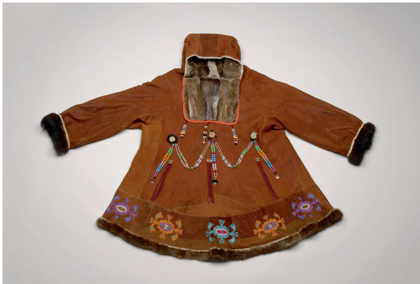
Abb. 18 Korjakische Festkleidung ( Kuchljanka ), Kamtschatka, Tiličiki · 2002 · Rentierfell, Perlen · Herstellerin: Tamara Chupchi · Slg. Kasten, Kulturstiftung Sibirien, Foto: A. Dreyer.

Freien wäre eine solche zusammen mit der Verstorbenen auf dem Scheiterhaufen verbrannt worden.