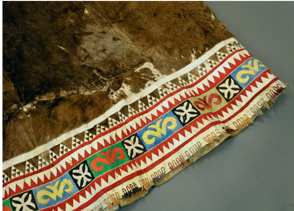
Abb. 19 Geometrische Muster und Flormotive auf der älteren korjakischen Festkleidung · IA 2911, Staatliche Museen zu Berlin – Preußischer Kulturbesitz © Ethnologisches Museum.

getragen wurde. Auf letzteren erkannte Jochelson nur geometrische Muster und keine realistischen Darstellungen von Menschen oder Tieren, was ihn verwunderte, da solche Abbildungen gerade auf der Zeremonialkleidung anderer sibirischer Völker 28 häufig anzutreffen sind und dort Hilfs- und Schutzwesen repräsentieren.