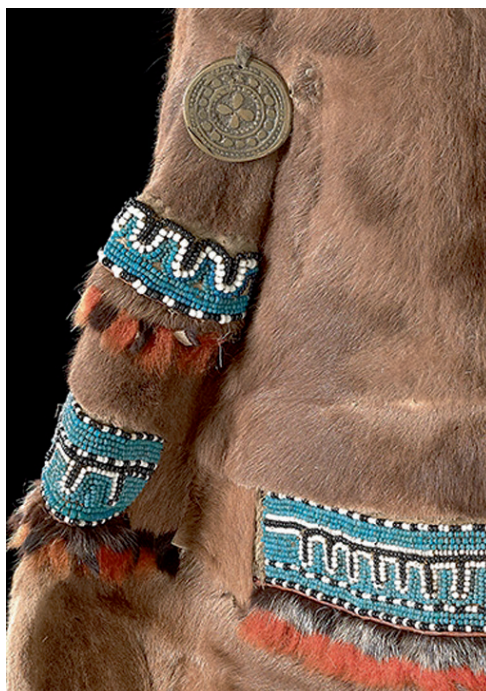
Abb. 1 Perlenornament auf evenischer Festkleidung · I A 2247, Staatliche Museen zu Berlin – Preußischer Kulturbesitz © Ethnologisches Museum, Foto: Claudia Obrocki.

entgegenzuwirken. Für die Umsetzung dieser Ziele werden Forschungsprojekte, Workshops und Seminare, Ausstellungen und Gastspiele zu Tanz- und Gesangskunst durchgeführt. 4