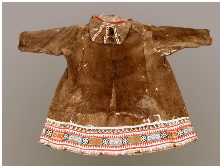
Abb. 6 Korjakische Festkleidung · IA 2913, Staatliche Museen zu Berlin – Preußischer Kulturbesitz © Ethnologisches Museum.

Zeit hatte Bunge nicht nur brieflichen Kontakt mit Adolf Bastian sondern auch mit dem Sammler Priklonski. Viele der auf dieser Expedition gesammelten Stücke verkaufte Bunge nach seiner Rückkehr 1887 dem Ethnologischen Museum in Berlin. Heute befinden sich 18 Objekte von Bunge in der Sammlung Ost- und Nordasien.