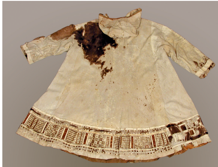
Abb. 5 Korjakische Festkleidung · IA 2913, Staatliche Museen zu Berlin – Preußischer Kulturbesitz © Ethnologisches Museum.