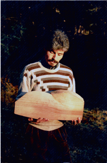
Abb. 2 E. Kasten mit dem Rohling einer Rabenmaske für die spätere Ausstellung im Ethnologischen Museum Berlin, Kingcome Inlet · 1988.