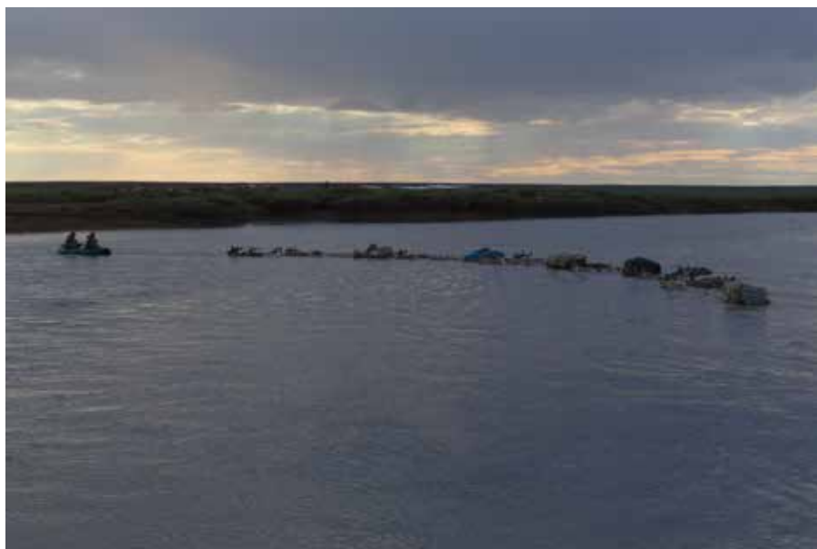
Рис. 9. Переправа через р. Морды-яха, июнь 2015 г. Ямальский район ЯНАО, фото авторов.