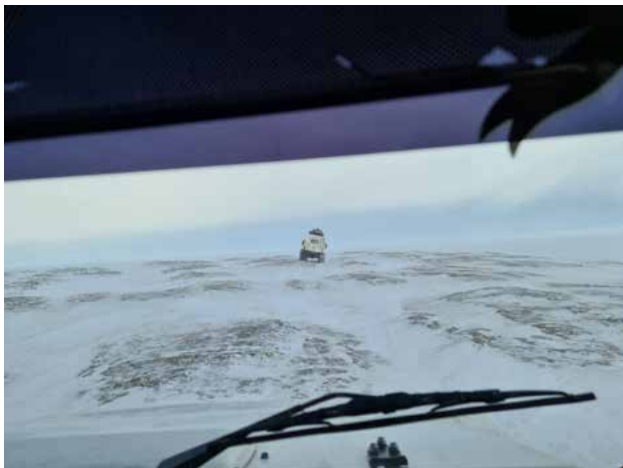
Рис. 3. Ледяная корка (темные участки) на бесснежных возвышенностях в тамбейской тундре, апрель 2021 г. Ямальский район ЯНАО, фото авторов.