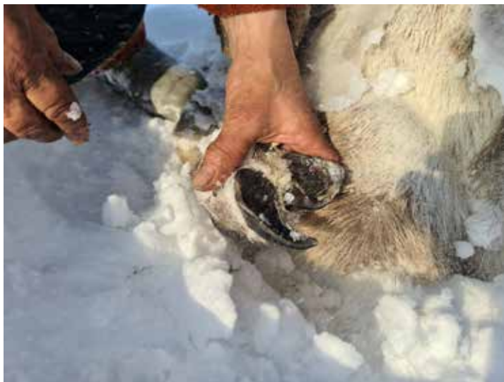
Рис. 6. Хозяева показывают стертые из-за гололеда копыта, апрель 2021 г. Ямальский район ЯНАО, фото авторов.