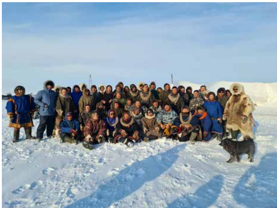
Рис. 7. Тамбейские пастухи, собравшиеся на импровизированный коралль, апрель 2021 г. Ямальский район ЯНАО, фото авторов.

Необходимо подчеркнуть, что критические явления для оленеводства становятся также управленческими вызовами и для властей региона. Администрация Ямальского района и с. Сеяха совместно с промышленными компаниями, работающими на территории сеяхинской тундры, уже с конца декабря приняли ряд мер по экстренной поддержке кочевых семей, попавших в зону бедствия. Пастухи постоянно ездили на снегоходах для поиска и сбора разбежавшихся оленей, поэтому была организована бесплатная раздача бензина на факториях и в вахтовом поселке Сабетта (Рис. 7). Туда же были доставлены десятки тонн