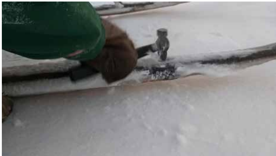
Рис. 2. Откалывание льда с нарты после дождя, декабрь 2018 г. Ямальский район ЯНАО, фото авторов.