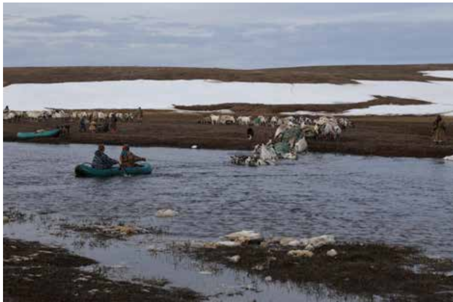
Рис. 8. Переправа оленеводов-частников через р. Лимбя-яха, май 2015 г. Ямальский район ЯНАО, фото авторов.