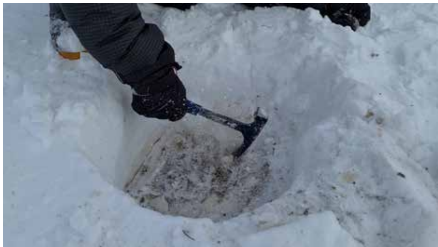
Рис. 4. Раскалывание ледяного слоя, покрывшего растительность, возле фактории Яхады-Яха, апрель 2021 г. Ямальский район ЯНАО.

Последний раз гололед на Ямале образовался зимой 2020-2021 гг. в северной тундре, избежавшей большого падежа 2013 г. По сообщениям оленеводов, здесь прошли три дождя: два в ноябре и последний, наиболее критичный – 5-6 декабря. После него ударила пурга, и установились сильные продолжительные морозы. В зоне бедствия оказались оленеводы, проживающие к северу от широты реки Сабетта-яха до фактории Тамбей и далее на север – до пролива Малыгина. В условиях малоснежной зимы ледяная корка образовалась на вершинах холмов и плакорах, к которым тяготеют лишайники (Рис. 3). «Севернее Яхады лед – как на озере», – говорили нам тамбейские ненцы, показывая на карте территорию оледенения в районе реки Яхады-яха, что подтверждали