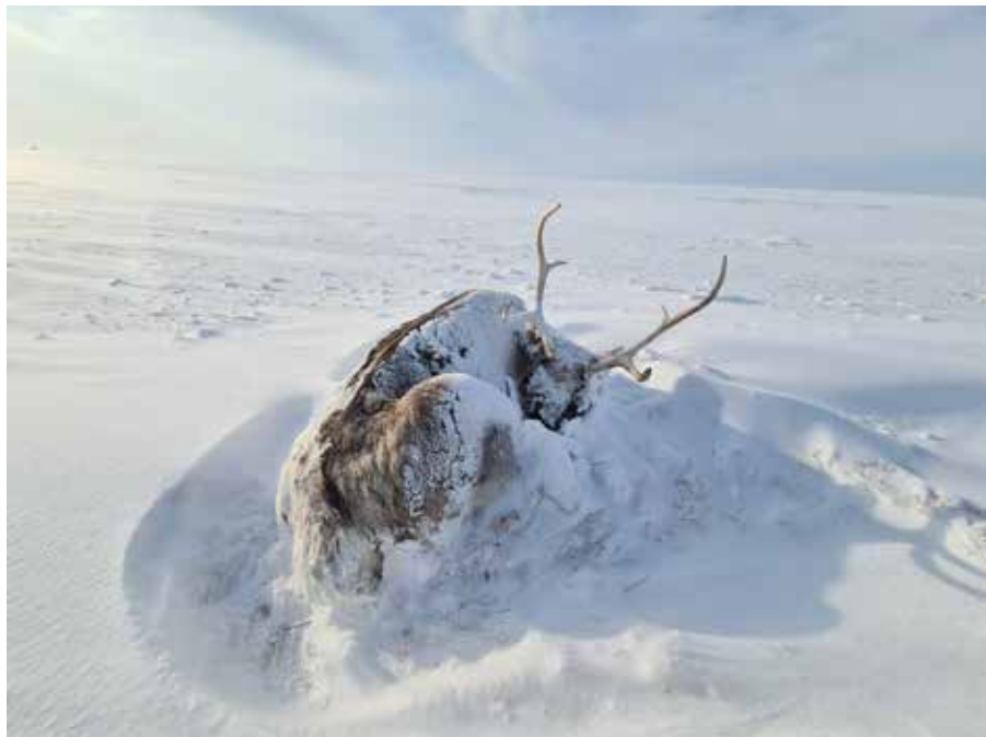
Рис. 5. Умирающий из-за гололеда домашний олень, апрель 2021 г. Ямальский район ЯНАО, фото авторов.